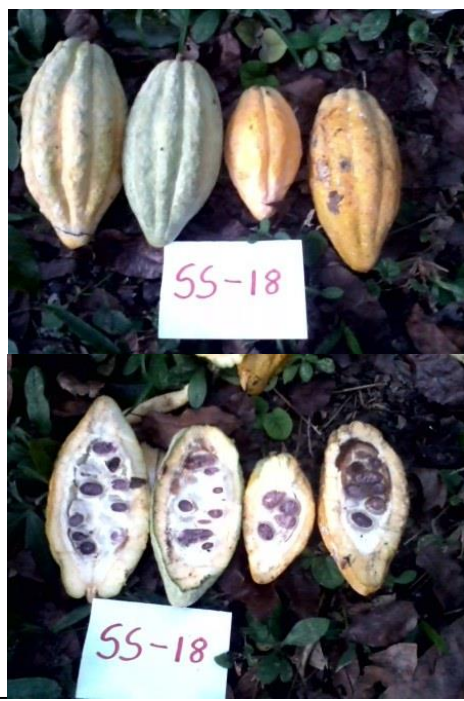
Figura 5: ISI e ISE en frutos inoculados.

No se consideró en el estudio el comportamiento productivo del material genético sujeto de evaluación.