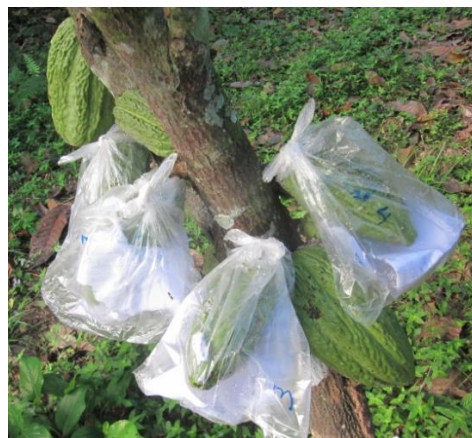
Figura 2: Frutos inoculados y protegidos

necrosada y susceptible entre 3,76 a 5,0 de área necrosada. Para el cálculo del ISE de la mazorca se hizo según la sintomatología y signos observados sobre las mazorcas inoculadas y se evaluó de acuerdo a la escala propuesta por Phillips M. (2006). Dónde: 0 significa fruto sano, grado 1 (0,1 a 1,25) con hidrosis, grado 2 (1,26 a 2,50) con tumefacciones y madurez prematura, grado 3 (2,51 a 3,75) Necrosis, grado 4 con micelio hasta cuarta parte de la necrosis y 5 micelio en más de la cuarta parte de la necrosis.