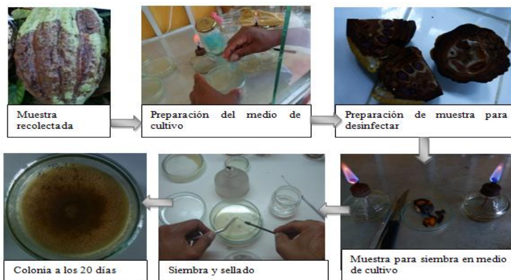
Figura 1: Procedimiento para aislamiento de Moniliasis, cuantificación de esporas y obtención de la cepa

Resultado 1. Obtención de cepa de moniliasis a partir de los frutos de cacao contaminados con la enfermedad. Para el cual se consideró el siguiente procedimiento: Colección de Muestra, Desinfección de Muestra, Preparación del medio de cultivo, Aislamiento de monilia e Identificación de aislamientos mediante el microscopio óptico. (Figura 1).