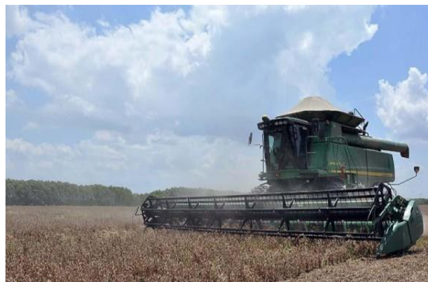
Figura 1. Uso Intensivo de Maquinaria en el sistema convencional.

En este contexto social, la actual estructura agraria de nuestro país, condicionada también por los efectos de la reforma agraria iniciada en 1953, nos permite identificar dos escenarios claramente diferenciados que condicionan a su vez dos formas o sistemas de producción agropecuaria que contrastan en la producción y generación de alimentos. Por un lado está el sistema tradicional acentuado en occidente, vale decir en lo que conocemos como la región del altiplano y los valles y el otro considerado como sistema de producción convencional concentrado con mayor preponderancia en oriente y la región del Chaco.