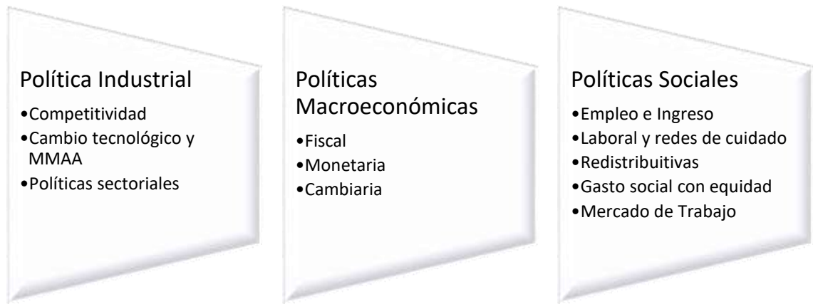
Figura 3. Políticas Públicas por grupo propuestas para el cambio estructural.

De manera muy concreta vemos que el cambio social se plantea en los siguientes pilares, expresados como políticas públicas: