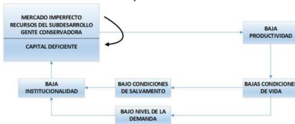
Figura 1. Circulo vicioso del subdesarrollo

Dicho de otra manera los bajos ingresos per cápita, sugieren que se dispone de un bajo estándar de vida, dadas las limitaciones de consumo, lo que no permite tener mecanismos de salvaguarda ante los cambios de precios del mercado o del nivel de vida, huelga decir, que los bajos ingresos no permiten ahorrar a las familias, por lo tanto, existe una ausencia o baja formación de capital. Cerrando este “circulo vicioso” de una supuesta iteración sin fin, se destaca, la ausencia o poca cantidad de recursos productivos, para elevar las magnitudes de los procesos.