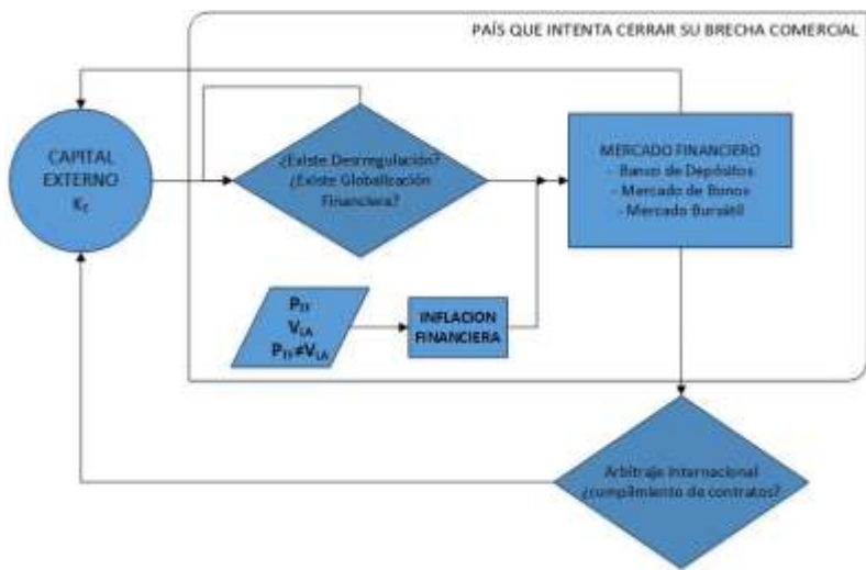
Figura 2. Modelo de desarrollo globalizado

Los efectos en la economía que lograron el New Deal v y de los acuerdos del Sistema Bretton Woods vi , que sesgaban el capital financiero a ser base del capital productivo, fue roto, pues se generó un proceso de desregulación vii y globalización viii del sistema económico (productivo, comercial y financiero). Se dieron condiciones para asumir el modelo neoliberal ix en la economía de los países latinoamericanos. La profundización de los mercados financieros, permitieron ampliar el banco de depósitos, el mercado de bonos y el mercado bursátil, en diferentes magnitudes y características.