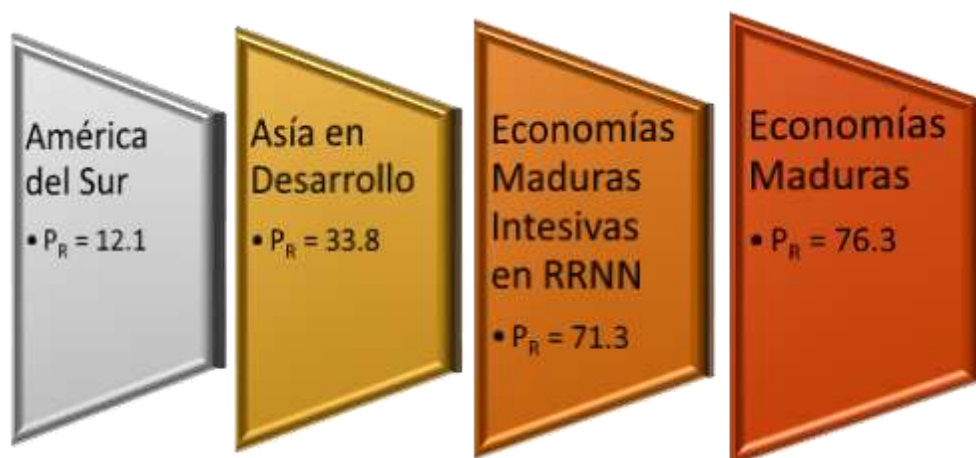
Figura 3. Valores de la Productividad Relativa en diferentes regiones

La CEPAL compara a los países respecto a indicadores de cambio estructural y de esfuerzo tecnológico, mide como resultado de la aplicación del modelo la productividad relativa ( P_R ) xii , el índice de adaptabilidad (IA) xiii , el porcentaje de exportaciones provenientes del uso de alta y mediana tecnología ( X\_HMT/X ) xiv , el indicador de sofisticación de las exportaciones (EXPY) xv , la participación relativa de las ingenierías (IPR) xvi , patentes xvii e investigación y desarrollo (I+D) xviii .