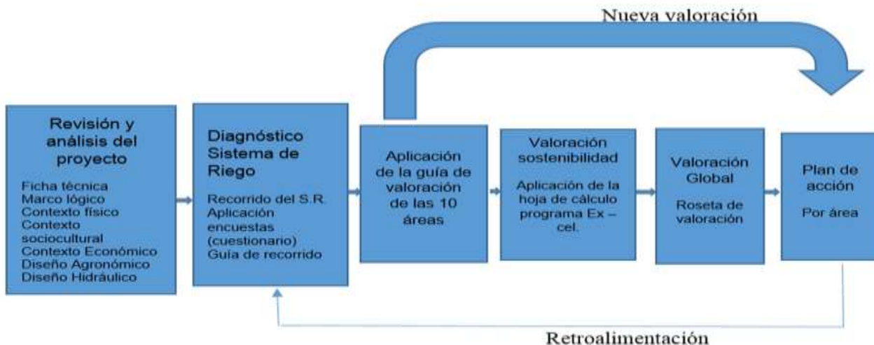
Figura 1. Modelo de evaluación.

Se utilizó el modelo propuesto por el investigador: