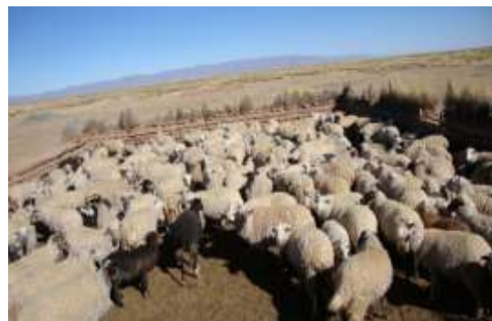
Figura 6. Corral de ovinos.