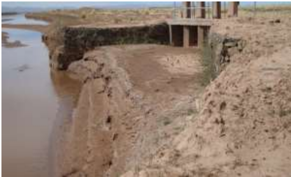
Figura 3. Compuertas trabadas por falta mantenimiento.