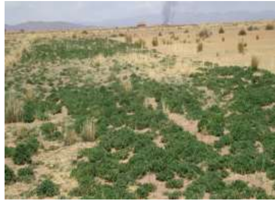
Figura 4. Alfalfa después de concluido el riego.