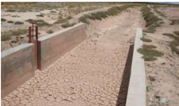
Figura 5. Estado de las compuertas de distribución.